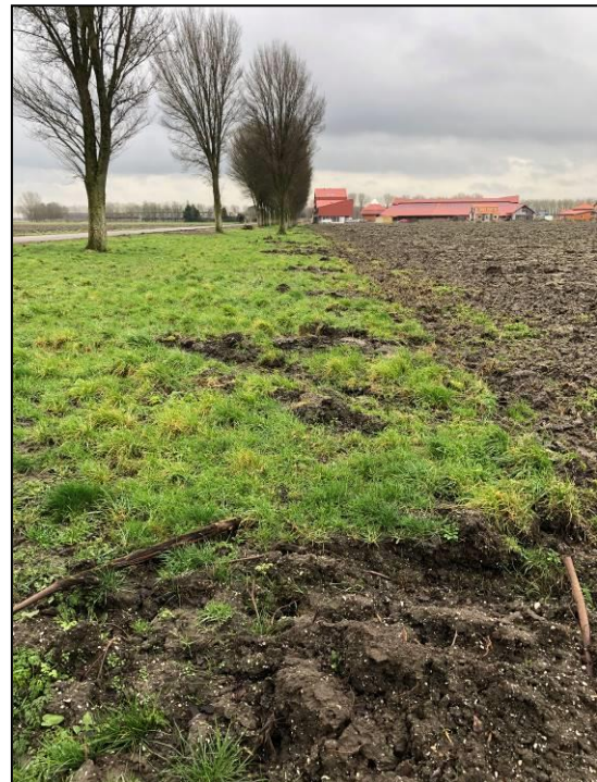
Figuur 2 Zware wortelschade door ploegen landbouwgrond

Voorals lang de Goudplevierweg is veel wortelschade aanwezig. De schade is recent en lijkt veroorzaakt door de ploegwerkzaamheden van naastgelegen landbouwgrond. De ploeg is vaak één tot twee meter te vroeg de grond in gezakt waardoor er omvangrijke wortelschade is ontstaan. Sommige wortels zijn soms geheel doorgetrokken. Dit is zichtbaar in de foto rechts (figuur 2). De wortelschade maakt geen onderdeel uit van het onderzoek naar onverenigbaarheid en zal verder dan ook niet bij het onderzoek betrokken worden.