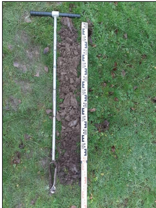
Figuur 4 Grondboring 2, Paradijsvogel