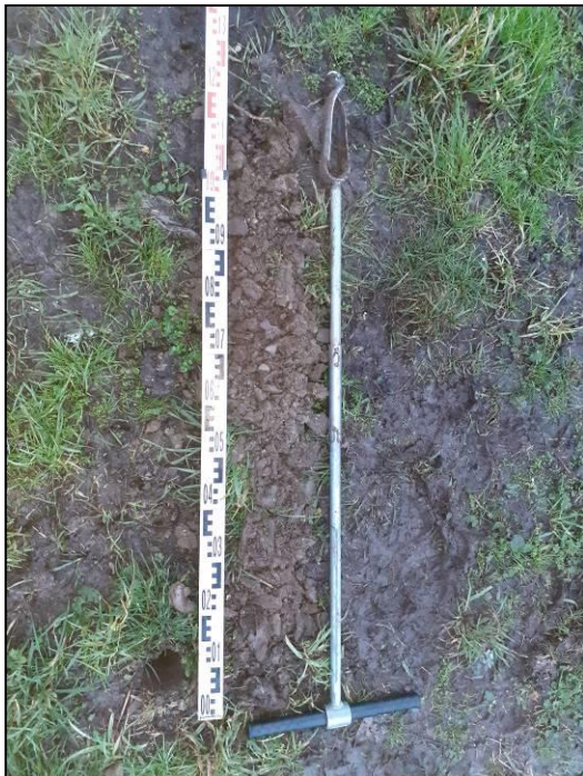
Figuur 5 Grondboring 3, Goudplevier

Het grondwater bevindt zich naar verwachting tussen de 120 en 140 centimeter. Hieronder zijn enkele voorbeelden van de boorprofielen weergegeven.