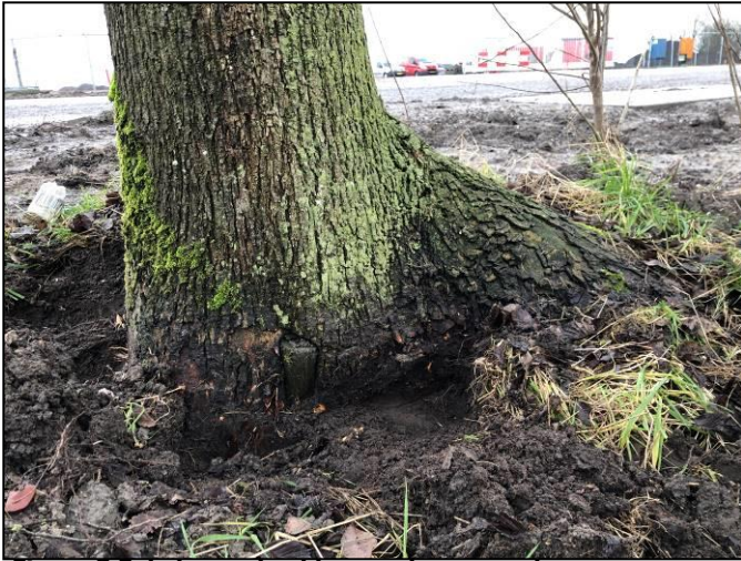
Figuur 3 Enkele voorbeelden van bomen met kenmerken van onverenigbaarheid. In bijlage 3 zijn nog meer foto's met voorbeelden weergegeven