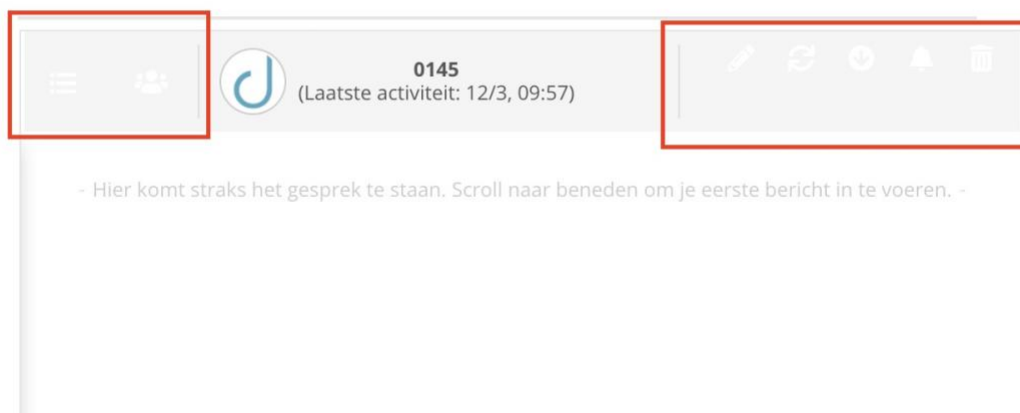
Figuur 4: Deze knoppen reageren niet op het toetsenbord (en hebben te weinig contrast)