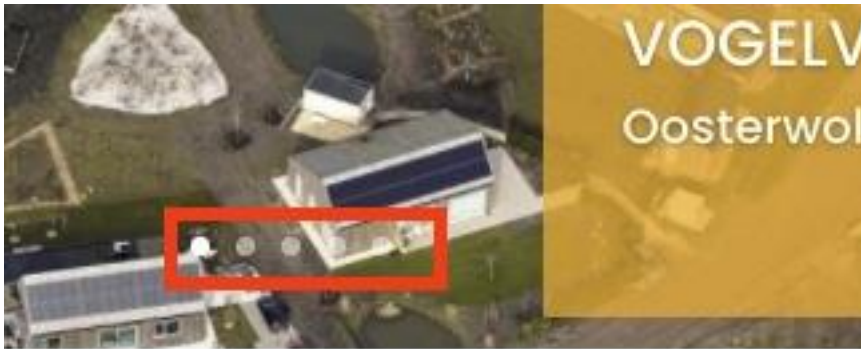
Figuur 3: Knoppen van de slider zijn te licht van kleur